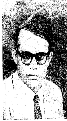
جائزة ٥٠٠٠ شلن

(تتمة المقال الافتتاحي) ان شرب الخمر - منذ أربعين سنة - فائد الوعى في إغماء . وان الشولين من هيدا الشعب هازلون بمك لا جادون . . . وانهم ان جاؤا بمك وهزرا رؤوسهم مع رؤوسكم فانما يفعلون ذلك على أساس الخديعة والرشح . . . فهم يبتنون لوجودهم الى جانب القادة الصالحين الجادين - أمام أعين الناس ثم يكونون بالتالى قد أعلنوا من أنفسهم الجبان . . . على هذه الحقيقة - باقادة العرب الاحرار - يجب أن تأخذوا شرب الخمر بين شعوبكم وأن تقبلوا في مقاعدكم هؤلاء الشولين الجانين ان عليكم أن تأخذوا البقال المحترم صفيحة فارغة ليسد بها في رفوف دكانه لحجرة أو فراغ . أما أن تأخذوا على اعتبارا أكثر من هذا . . . وأما أن تصدوا في أيديهم سيفاً من سيوف محرركم الكبير فان هذا السيف - يتحول الى قطعة من الخشب نخرة هشه لا تصالح حتى للوقود . . . وأما أن تلقوا على عاتقهم سهماً من أسهم البناء الضخم لاعزاز العروبة وترميم حولها وطولها وخطورة شأنها في العالم اللارد القوى فانكم لن تكونوا إلا كذلك الفيلسوف الذي ذهب ليستطلع - في مسائله - رأى جاره الطحان . . .